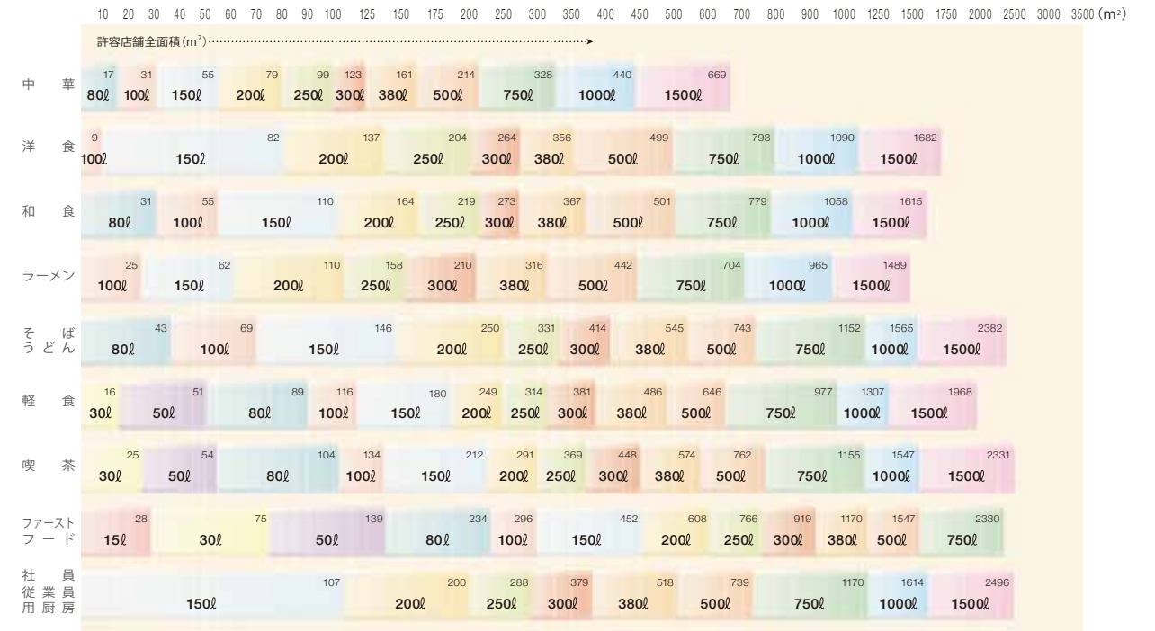
■店舗全面積からの機種選定(表-5)